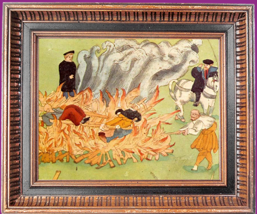
Quema de tres «brujas» en Baden, Suiza (1585). Ilustración de Johann Jakob Wick.