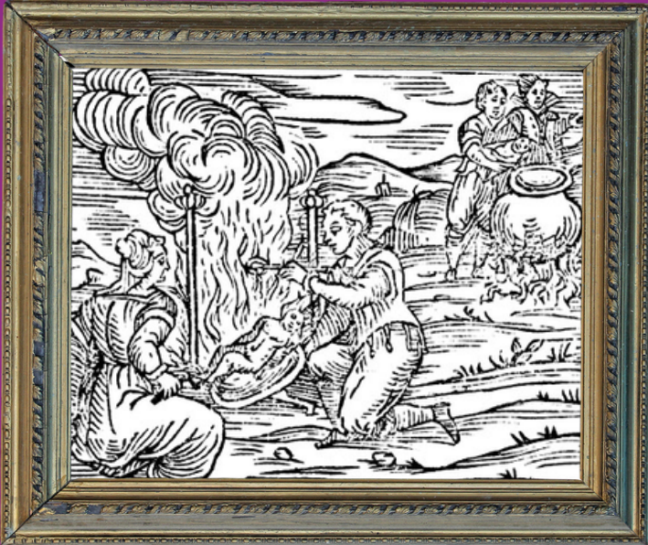
Grabado del Compendium maleficarum (1608) de Francesco Maria Guazzo que muestra la preparación del banquete del sabbat.